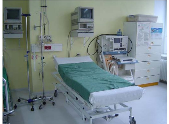
Die neue Notfallambulanz.