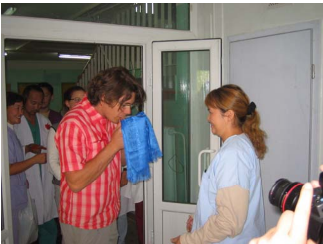
Traditionell: der Genuss von Milch.