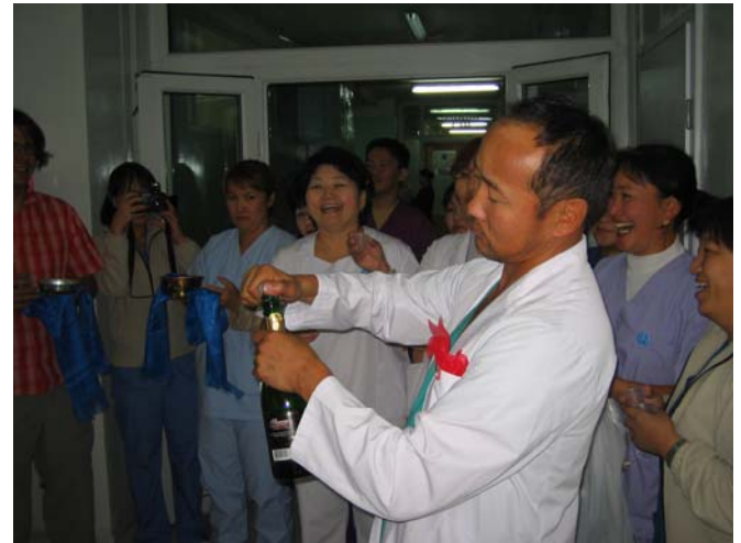
Zu gebührendem Anlass: Den Sektkorken knallen lassen!