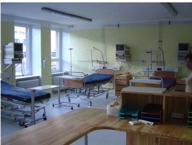
Schön langsam nimmt die Station Form an!